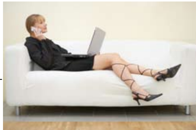
Arbeiten von zu Hause