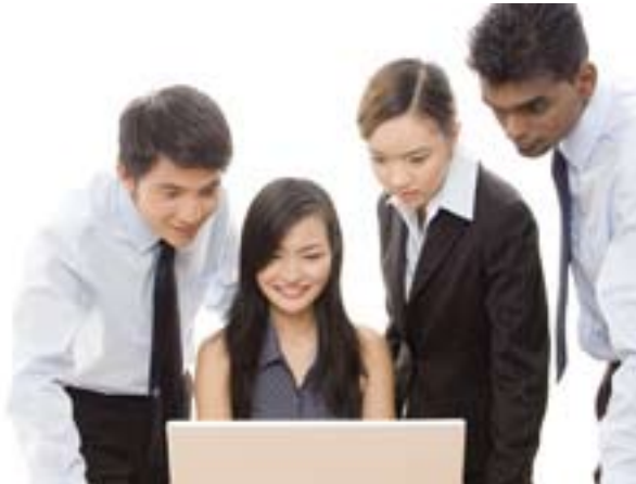
Arbeiten vom Büro

Mit FlatHunter Pro sind Sie nicht an einen Standort gebunden. Sie können Städteübergreifend arbeiten und so mehrere Filialen einfach und zuverlässig verwalten. Arbeitsplätze können in einem oder mehreren Büros eingerichtet werden. Sie können aber auch flexibel von zu Hause oder unterwegs arbeiten.